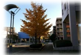
打瀬小学校もすぐ近く