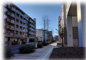
バス停が目の前なのは便利