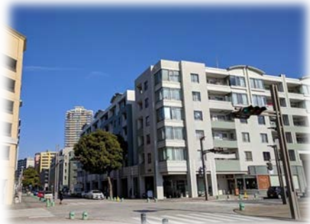
ブロムナードの大きな丸い木が目印

ロッテ優勝パレードで有名になったバレンタイン通りと ブロムナードが交わる街の中心に位置し、買物などがとても便利