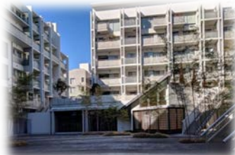
夏祭りも開かれるパティオ(中庭)